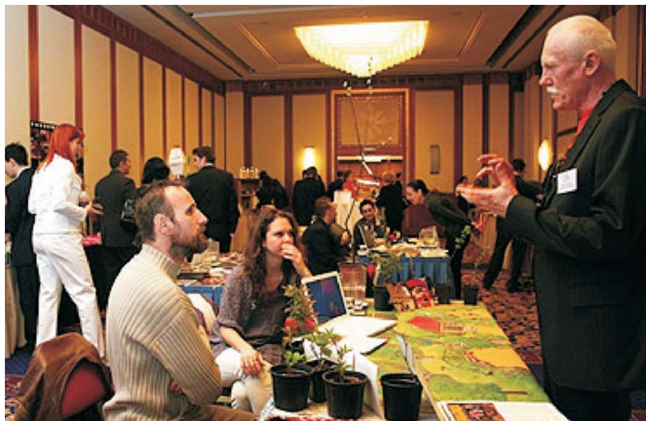
A NESST-Citi Társadalmi Vállalkozások Piactere és Vására 2010-ben