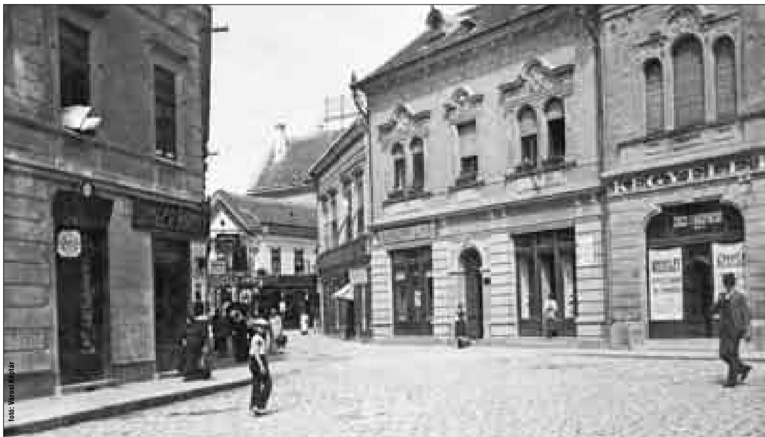
A felvétel még a belváros átépítése előtt készült, a kép közepén jól látszik a Szigethy-ház, amit a Hősök tere kialakítása és a Városháza átépítése kapcsán bontottak el