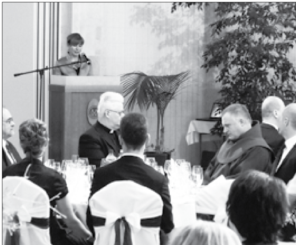
Az est fővédnöke Herczegh Anita, Áder János köztársasági elnök felesége

A többször is megszólított Bójte Csaba munkájuk eredményét ismertette, példaként mesélt egy lányról, aki hányatott évek után került az alapítvány gondozásába, és most Brüsszelben egy Európai Parlamenti képviselő asszisztenseként dolgozik. Vagyis, munkájuk gyümölcsöző, és azt bizonyítja, hogy a reménytelennek