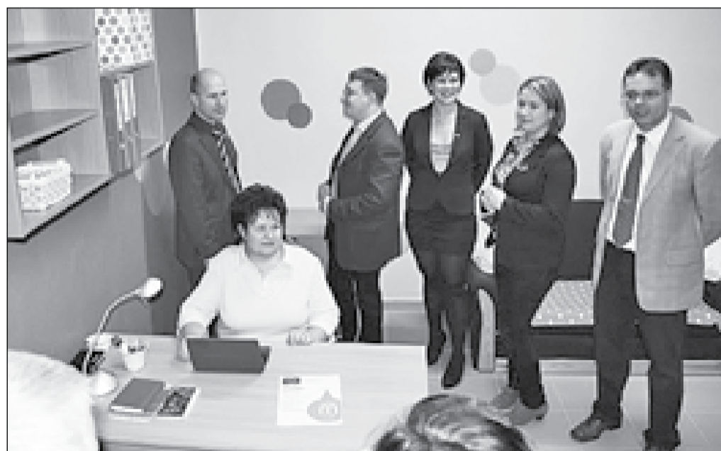
ITKE Pont megnyitó – kellemes hangulatú irodában várják a jelentkező önkénteseket

Elindult az „Önkéntesekkel az egészségtudatos életmóddal a Móri-árokban” elnevezésű TÁMOP-5.5.2-11/2-2012-00 projekt, a Székesfehérvári Zöld Alma Egészségfejlesztő Alapítvány szervezésében. Ennek keretében nyitotta meg kapuit december végén az Itt Kellesz Pont Iszkaszentgyörgyön. Az iroda olyan önkéntesek jelentkezését várja, akik segítenek elterjeszteni az egészségtudatos életmódot 10 településen. A fő cél az, hogy lehetőleg minden utcában legyen egy önkéntes, aki el látja a helyi egészségfejlesztési feladatokat.