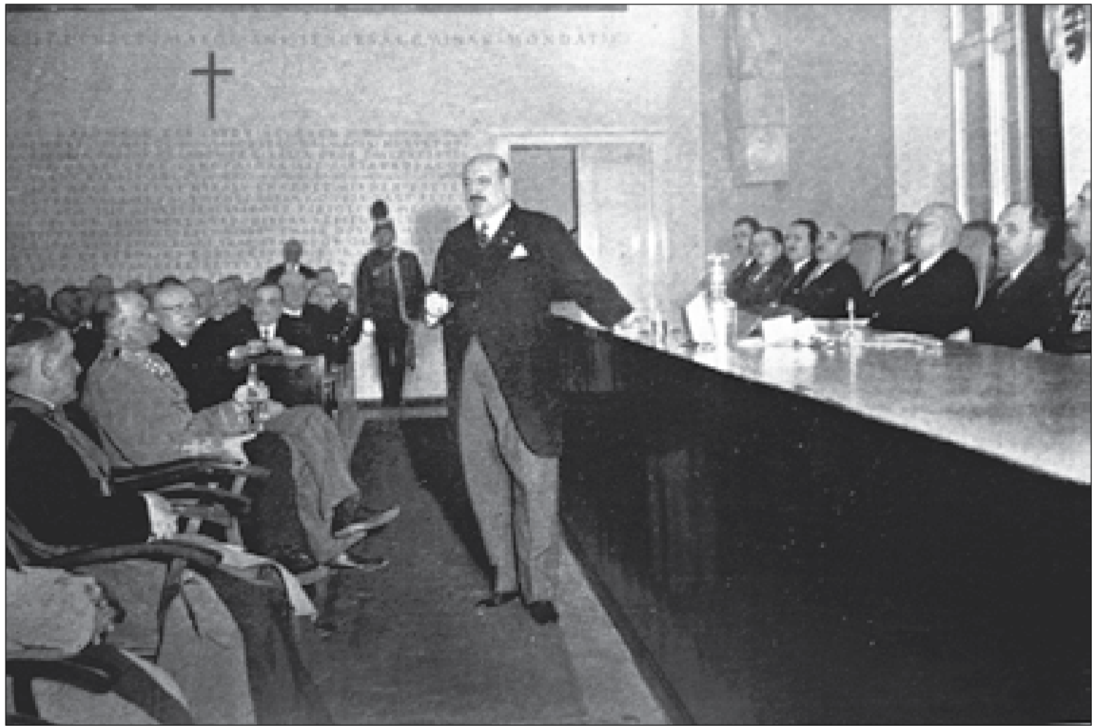
Az 1938-as szent év ünnepi megnyitója. Középen Hóman Bálint, akkori kultuszminiszter áll

Összefogásban és nehéz munkában nem volt hiány: a középületek megújultak, és polgármesteri felhívásra szinte minden magánház külsejét felújították, ami minden téren próbára tehetette a város polgárait. Ennek, és az egész évet végigkísérő emelkedett ünnepi hangulatnak köszönhetően valóban Székesfehérvárra figyelt az egész ország. Mindjárt 1938 elején, a január 17-én rendezett dísz-