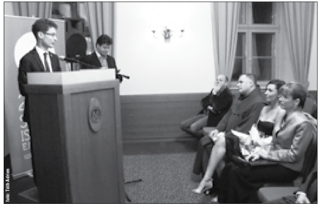
A rendezvény előtti sajtótájékoztatóján a polgármester örömét fejezte ki, hogy a jótékony estélyen a Magyar Király Hotelben kinőtte régi helyszínét, a Hiemer-ház báltermét, ezért az új helyszín

Egy eseményről sokféle módon lehet tudósítani. Lehet úgy, hogy a száraz tényeket mondjuk el, lehet úgy, hogy az elhangzó beszédeket idézzük fel, netán felsoroljuk a résztvevőket, fellépőket... és lehet úgy is, hogy személyes benyomásainkat, élményeinket is megosztjuk az Olvasóval. Nos, én mindenképpen utóbbihoz ragaszkodom. Mindig, de most különösen. Hiszen csak kívánni tudom mindenkinek azt az élményt, amiben részem lehetett a január 5-i jótékony estélyen a Magyar Király Hotelben. Mert ki ne lenne büszke arra, ha alkotó-