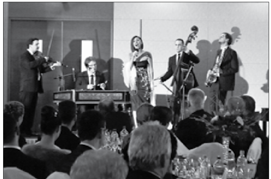
A Tárkány Művekkel közösen lépett színpadra Miklósa Erika operaénekesnő, aki az est háziasszonya volt