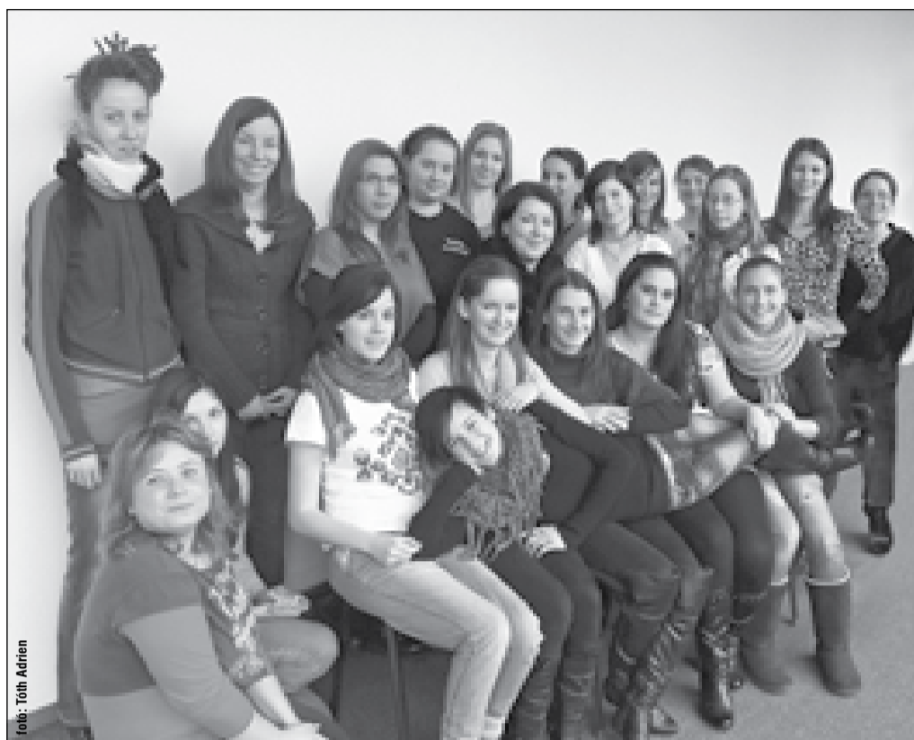
A csapat összeállt, sőt már a képzés is elkezdődött számukra. A jövő ifjúságsegítőit fehérvári szakemberek képzik