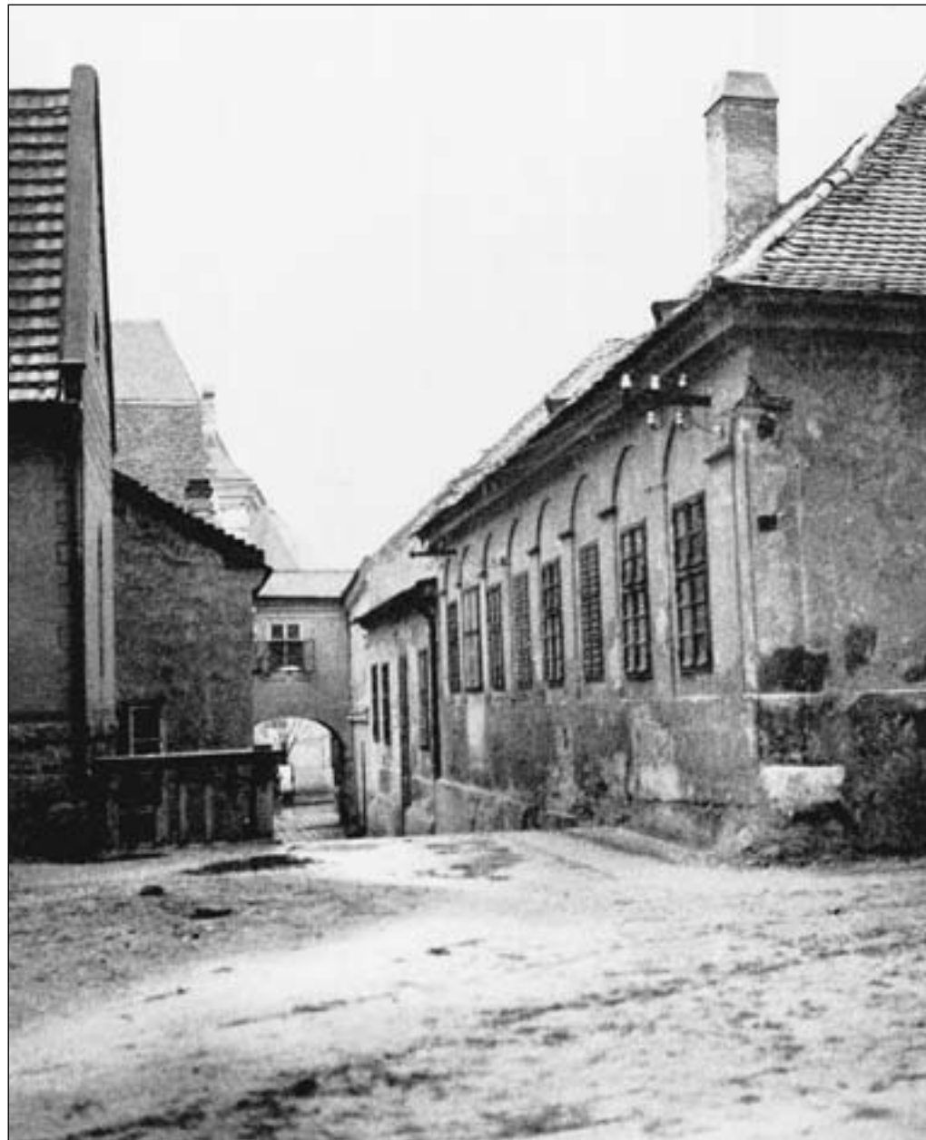
A Városház köz a Székesegyház felől 1912 (a Bierbauer-ház és a városháza összekötése után) és 1936 (a Bierbauer-ház bontásával kezdődő átalakítás) közötti időből. Jobbról az Obermayer-ház, az egykori magyar iskola, a Kunze-ház, az ingyenes orvosi rendelő és az egykori német iskola

A köz egymás hegyén-hátán álló, bár a legreggebbi barokk városmaghoz tartozó épületeit a Szigethy-házzal (Csemege kereskedés a Fekete Elefánthoz, Városház köz 6.), az Obermayer-házzal és az egykori Ormai kocsmával (az Ormai név az Obermayer család magyarosított neve volt), később vegyvizsgáló állomással együtt lebontották, a Zichy palota homlokzatát mindkét irányban kiegészítették, a Székesegyház felé befordították, és a főépülettel összekapcsolták. Az egykori Városháza épületét az udvar felől szinte észrevétlenül egy új emeletes szárnyal bővítették, s egy átjáróval a kétemeleteshez belülről hozzacsatolták. Erről emlékirataiban Kotsis Iván meglepődéssel szolt, megjegyezve, hogy a közgyűlési teremmel szemben kibontották a régi Városháza árkádsorát. Az így