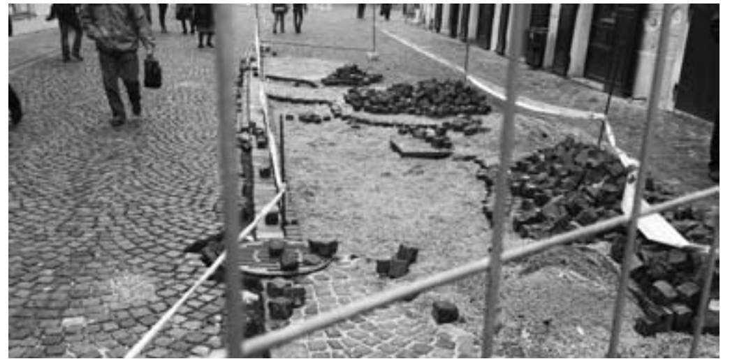
Ma már nem fával kockázunk, hanem kövekkel. Ráadásul legális úton érkezett kövekkel. És a hölgyek öröme a Fő utca megújítása kapcsán az eddig lerakott kockaköburbolatra is cipőkimélővé válik a meseterék keze nyomán

a zsigerekben. Jól okoskodott, amikor kiült a városháza elé, és várta a sültgalambot. Egy pepita öltönyös újságíró személyében repült az ölébe. Nyelvünket törő tőzsei szakértőnek bemutatkozva küldöncként használta a gyanútlan tollnokot. Burkolt üzenetet küldött a városatyáknak, biztosra vette, hogy az üzenete célba talál. Nem tévedett. Az üzenet úgy szólt, hogy használt fát kell vásárolni e célra, mégpedig mielőbb, mert éppen felfutóban az ára. Találjuk ki, ki volt az, aki véletlenül rendelkezett 15 vagonnyi kitűnő minőségű használt útburkolat kockáival. 9000 aranykorona a vételár, ebből 1000 aranykorona az előleg. Létrejött az alku. A fa olcsó, 6-7000 aranykoronát spórolhat a város. Az ötletéhez szélhámosunknak már csak fát kellett keresnie. Ekkor talált rá a fakockákkal burkolt Rottenbiller utcára. 15 vasúti kocsi, 15 munkanélküli férfi, néhány társzeker, piros csikos útlezáró tábla, feszítővas, lapát. Szélhámosunk az előlegről nagyvonalú bérezést biztosított a munkásoknak, fuvarosoknak, ezért a munka flottul haladt. Lezárt útszakaszok, felszedett fakocka halmok, vas-